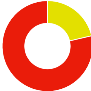
Költség a kiválasztott időszakban

Földgáz (épület) Villamos energia (épület)