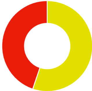
Ekvivalens energia fogyasztás a kiválasztott időszakban

Földgáz (épület) Villamos energia (épület)